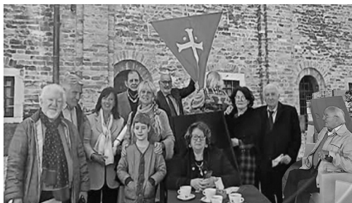
Poeti a San Liberale mercoledì 27 aprile